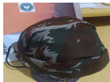
FACE OPOSTA SEM O LOGOS PAC USO CIVIL