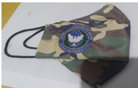
FACE EM DESCANSO